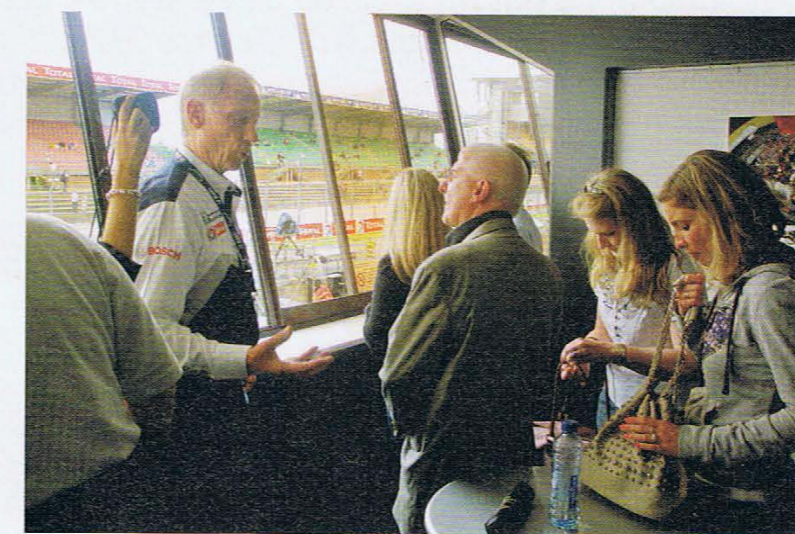
Les entreprises invitées au Mans à l'occasion des 24 Heures peuvent découvrir les stands des marques (ici Peugeot) et échanger avec les responsables de la course. Un moment fort avant de parler business...